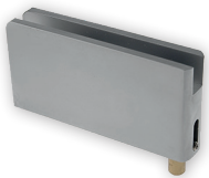
Art. B43 Kleines Band für 6 mm Glasdicke.