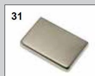
31 Edelstahl matt