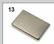
13 Edelstahl ähnlich - PVD