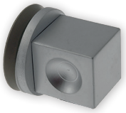
Art. 5Q10 Hip-Q Knopf.