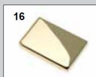
16 Messing poliert Effekt - PVD