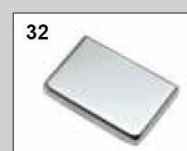
32 Edelstahl poliert

Für detaillierte Informationen und technische Daten kontaktieren Sie uns unter: Tel.: +49(0)7133-202603 - info@minusco.de Technische Leitfäden und Prospekte zum Download auf unserer Homepage