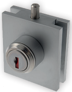
Art. B46 Schloss für 6-8 mm Glas. Eintourig.