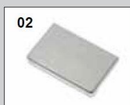
02 EV1 Natur