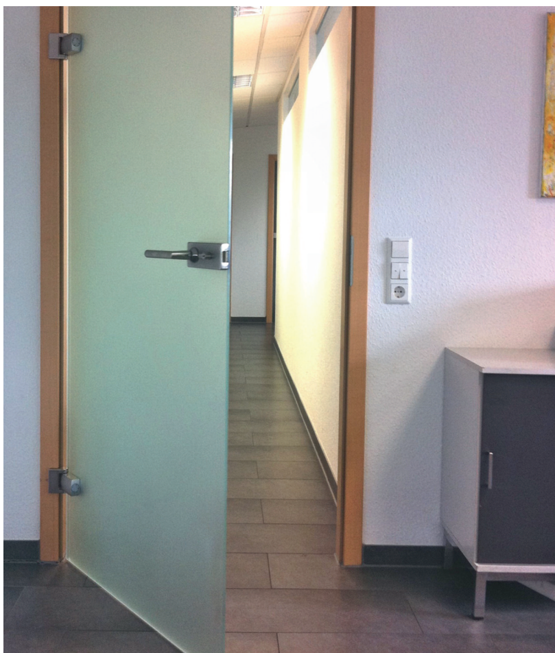
Die Avantgarde Line-Tür verfügt über eine hydraulische Rückführung.

Holz und Glas gehen im Innenausbau eine natürliche Verbindung ein. Damit die edlen Werkstoffe bei den Türen zusammen funktionieren, bietet der Markt ein speziell für Holzzargen entwickeltes Glastürband.