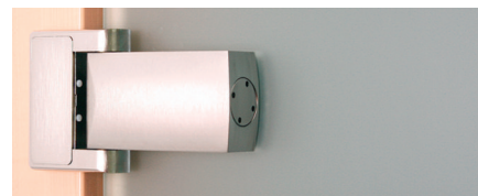
Das Hydraulikband hat der Anbieter speziell für Holzzargen entwickelt.